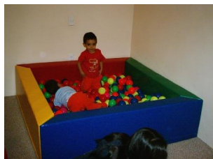
Alberca de Pelotas Cuadrada 145cm Espuma